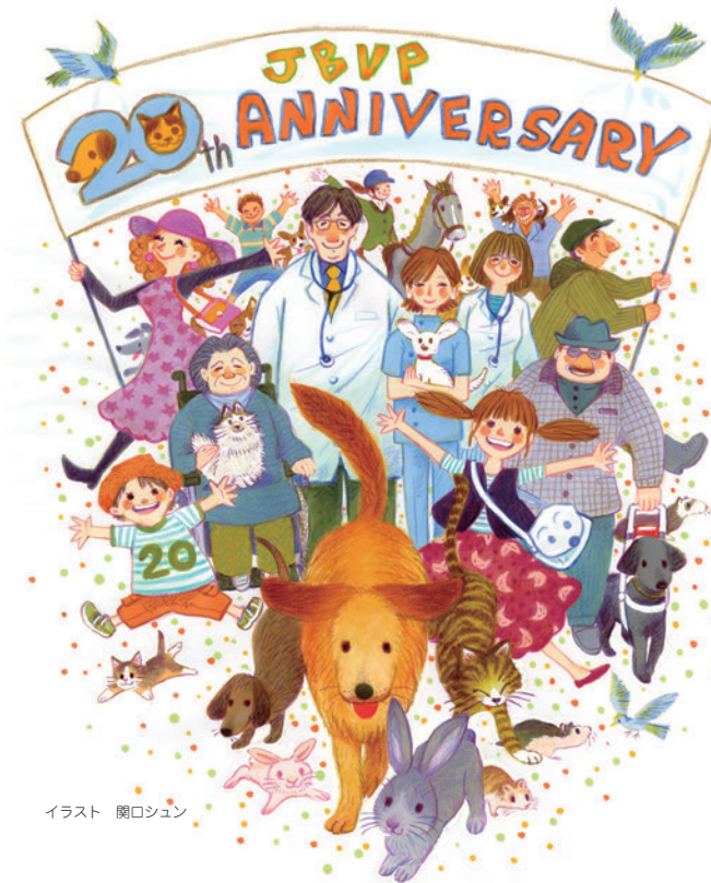
イラスト 関口ジュン